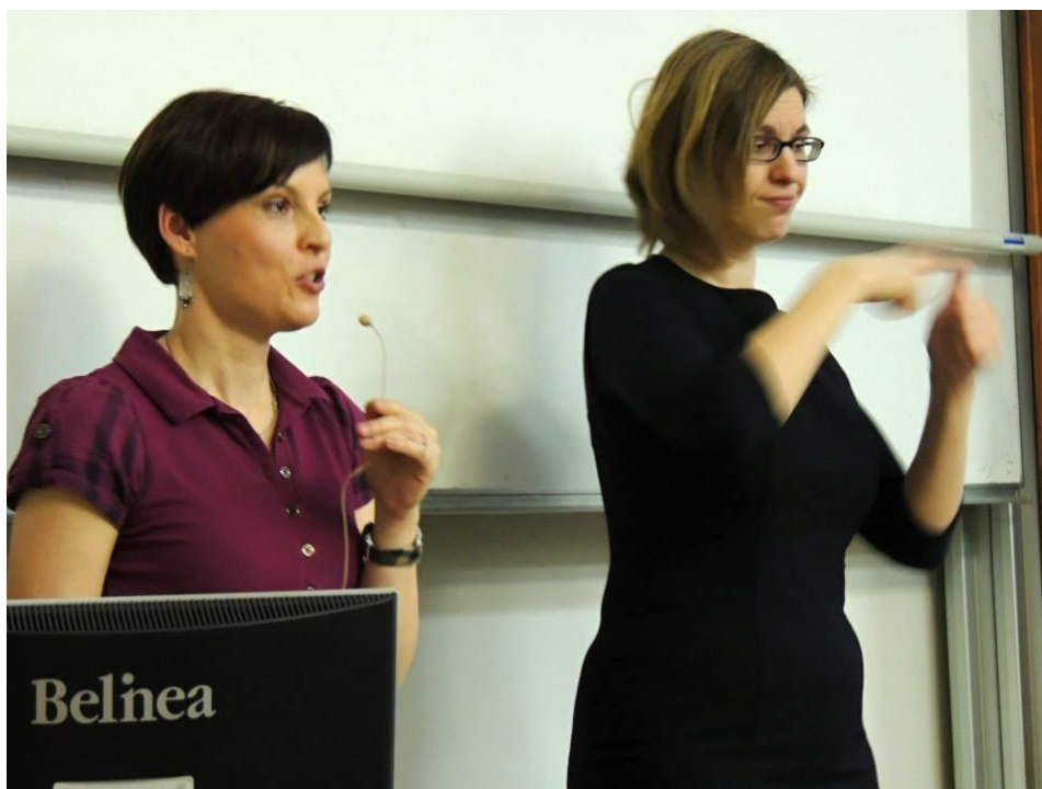
Obr.1: Tlumočení z mluvené češtiny do českého znakového jazyka (14. 1. 2014, den otevřených dveří FF UK v Praze,)

Tlumočení mezi češtinou a českým znakovým jazykem (viz obr. 1) a obráceně většinou využívají neslyšící studenti. Momentálně zaměstnáváme tři tlumočnický (celkem 1,5 úvazku) a spolupracujeme s několika externisty. U tlumočení probíhá i supervize (od r. 2013 experimentálně, od r. 2014 pravidelně). V r. 2012 i 2013 jsme odtlumočili přibližně 1 000 hodin.