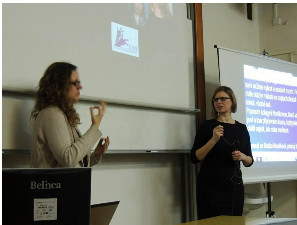
Obr.2: Tlumočení z českého znakového jazyka do češtiny a simultánní přepis na plátno (14. 1. 2014, den otevřených dveří FF UK v Praze,)

Jeden student nebo pedagog si může na jednu „akci“ objednat buď tlumočení, nebo přepis. Pokud je však přítomno více studentů nebo pedagogů a někteří požadují tlumočení a někteří přepis, poskytujeme obojí (viz obr. 2). Pokud není předem písemně dohodnuto jinak, text přepisu se nikam neukládá a nesmí se dále využívat a zpracovávat.