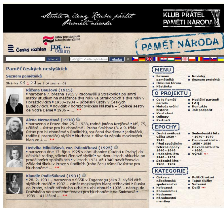
Obr.4: Paměť českých neslyšících (web projektu Paměť národa)